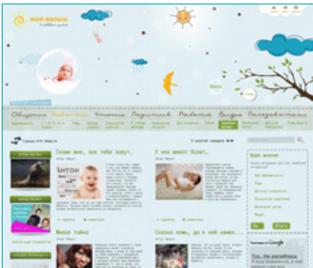
Нет правых рекламы

Наш информационный портал расскажет вам все о самых тонких нюансах, сопровождающих беременность, поможет сориентироваться в сложных вопросах, касающихся родов. На сайте вы найдете немало материалов, посвященных проблемам вскармливания и ухода за новорожденным малышом, а также статьи о психологии и воспитании дошкольников, младших школьников и подростков.